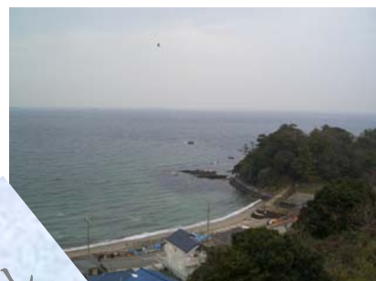
3階から目下を撮影