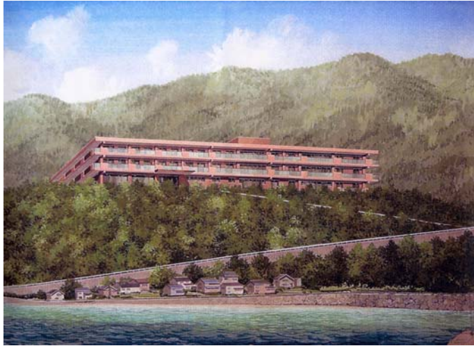
完成（外観）イメージ図