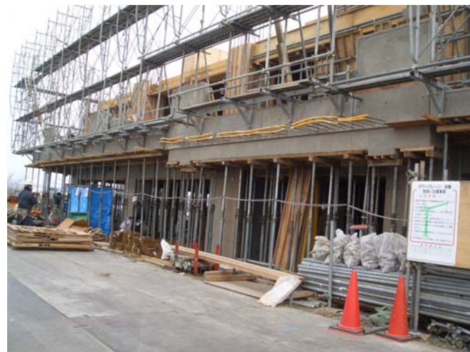
1階（玄関付近）工事中