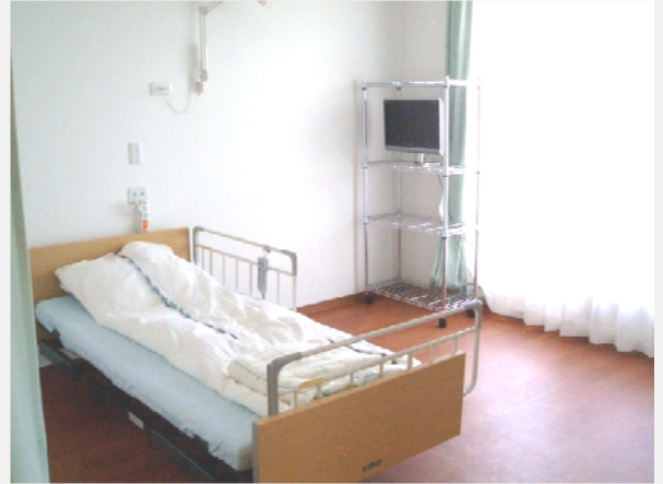
↑ ゆったりくつろげ、明るく清潔感ある個室(イメージ)