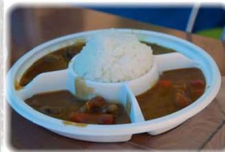
← カレーバイキング 500円でカレー4食満喫

*もれなく会場内で使用できる 100円券GET さらに、公式Facebookページ 「いいね!」でもう1枚