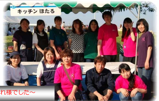
まるペ スタッフの皆さん ~2日間お疲れ様でした~

*もれなく会場内で使用できる 100円券GET さらに、公式Facebookページ 「いいね!」でもう1枚