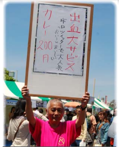
会長みずからお手製看板 かけてよびこみ宣伝活動中

ご来店くださいましたお客様に感謝し“まち”のにぎわい・皆さんの笑顔に支えられたイベント出店でした。