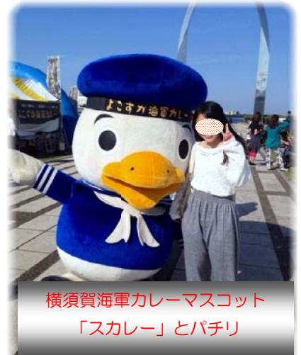
横須賀海軍カレーマスコット 「スカレー」とパチリ